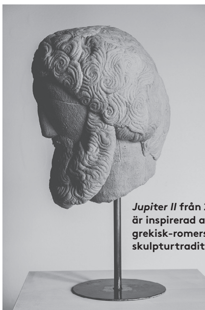
Jupiter II från 2020 är inspirerad av grekisk-romersk skulpturtradition.