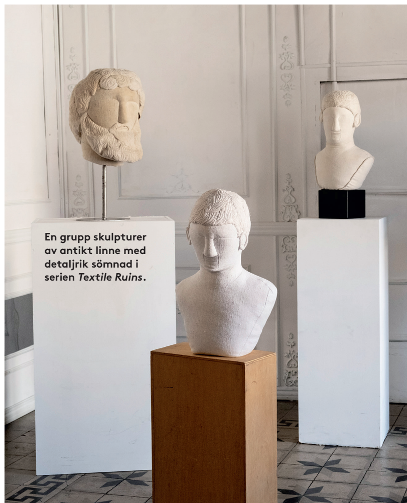
En grupp skulpturer av antikt linne med detaljrik sömnad i serien Textile Ruins .